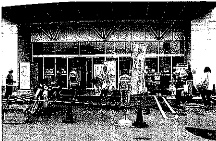
マルナカ国分寺店